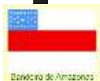
Bandeira do Amazonas