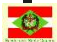
Bandeira do Santa Catarina