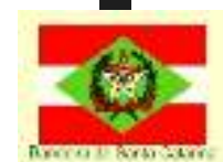
Bandeira do Santa Catarina