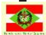
Bandeira do Santa Catarina