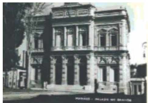
Palácio Rio Branco - numa de suas salas ocorreu