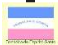
Bandeira do Espírito Santo