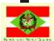
Bandeira do Santa Catarina