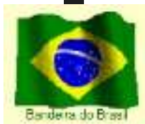
Bandeira do Brasil