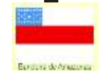
Bandeira do Amazonas