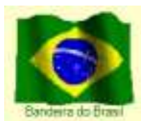
Bandeira do Brasil