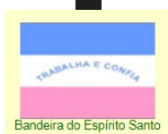
Bandeira do Espírito Santo