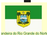
Bandeira do Rio Grande do Norte