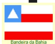
Bandeira da Bahia