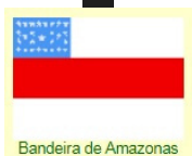
Bandeira de Amazonas