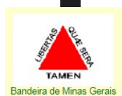
Bandeira de Minas Gerais