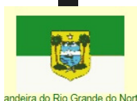
Bandeira do Rio Grande do Norte