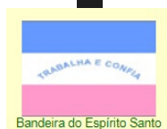
Bandeira do Espírito Santo