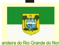
Bandeira do Rio Grande do Norte