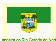
Bandeira do Rio Grande do Norte