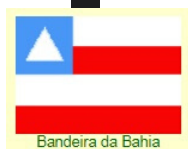
Bandeira da Bahia