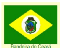
Bandeira do Ceará