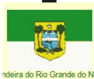
Bandeira do Rio Grande do Norte