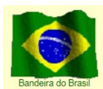
Bandeira do Brasil