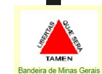
Bandeira de Minas Gerais