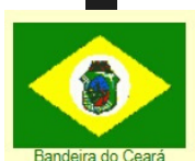
Bandeira do Ceará