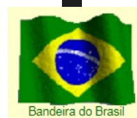
Bandeira do Brasil