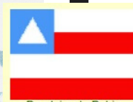
Bandeira da Bahia