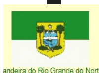
Bandeira do Rio Grande do Norte