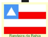
Bandeira da Bahia