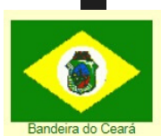
Bandeira do Ceará