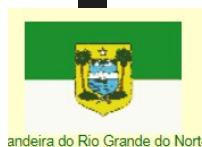
Bandeira do Rio Grande do Norte