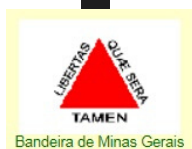
Bandeira de Minas Gerais