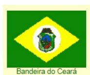
Bandeira do Ceará