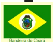
Bandeira do Ceará