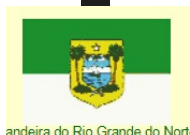
Bandeira do Rio Grande do Norte