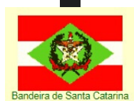
Bandeira de Santa Catarina