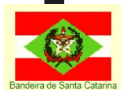
Bandeira de Santa Catarina