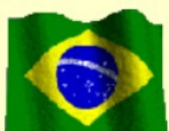
Bandeira do Brasil