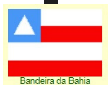
Bandeira da Bahia