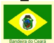
Bandeira do Ceará