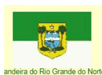
Bandeira do Rio Grande do Norte