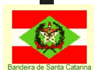
Bandeira de Santa Catarina