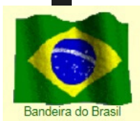
Bandeira do Brasil