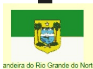
Bandeira do Rio Grande do Norte