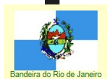
Bandeira do Rio de Janeiro