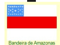
Bandeira de Amazonas