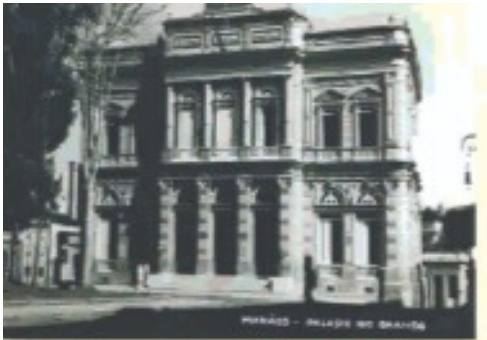
Palácio Rio Branco - numa de suas salas ocorreu