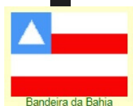
Bandeira da Bahia