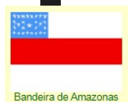
Bandeira de Amazonas