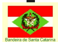
Bandeira de Santa Catarina