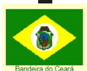
Bandeira do Ceará