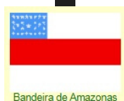
Bandeira de Amazonas