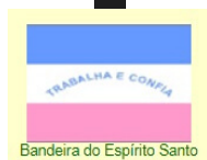
Bandeira do Espírito Santo