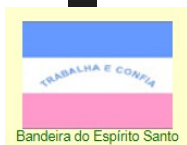
Bandeira do Espírito Santo