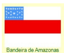
Bandeira de Amazonas