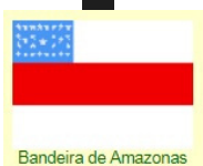
Bandeira de Amazonas