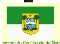
Bandeira do Rio Grande do Norte