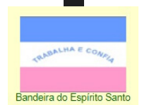
Bandeira do Espírito Santo