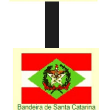
Bandeira de Santa Catarina