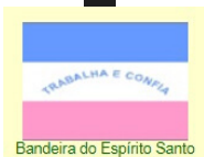
Bandeira do Espírito Santo