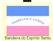
Bandeira do Espírito Santo