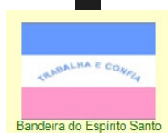
Bandeira do Espírito Santo