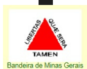
Bandeira de Minas Gerais