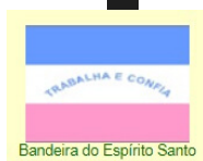
Bandeira do Espírito Santo