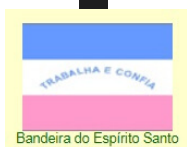
Bandeira do Espírito Santo