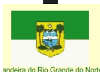
Bandeira do Rio Grande do Norte