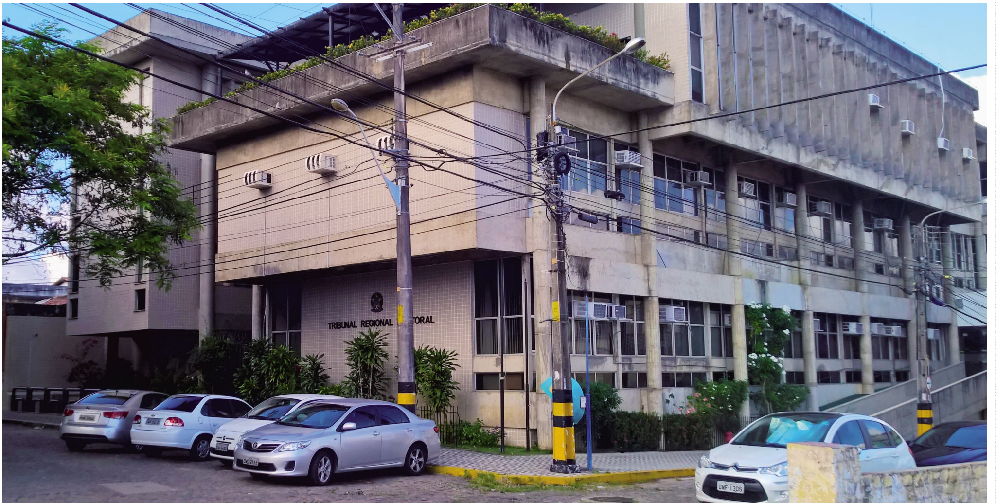
▲ Edifício-sede do TRE/RN inaugurado em 1980 e sede oficial do tribunal até o ano de 2018. ►