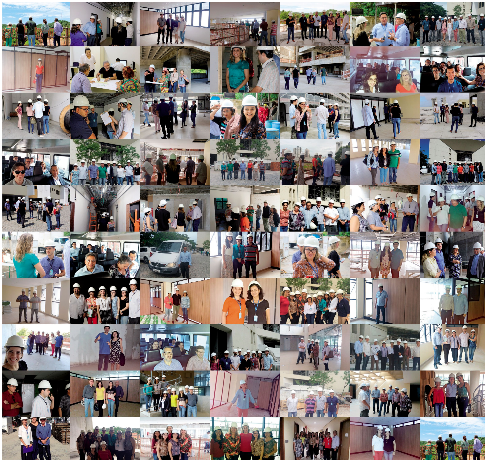
▲ Visita dos servidores à construção da nova sede do TRE RN ►