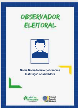
Masculino – frente