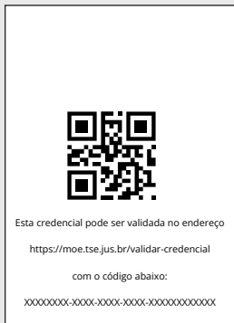
Feminino – verso