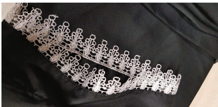
Modelo da renda dos punhos das togas que foram adquiridas recentemente.

Deverão ser adquiridas 04 (quatro) togas modelo Francês (universal), confeccionada em tecido microfibras, 100% poliéster, com alamares frontais pretos, renda branca nos punhos (modelo da renda conforme foto abaixo), sobremanga até a altura dos cotovelos, comprimento aproximado de um palmo acima dos tornozelos, cordão (torsal) preto. Para não correremos o risco de adquirir novas togas com o modelo diferente das que foram adquiridas recentemente, sugiro, caso a legislação permita, que seja efetuada compra direta à empresa vencedora do certame anterior (PAE 126832017), a qual já forneceu os tamanhos “M”, “G” e “GG”, de modo a garantir a similaridade.