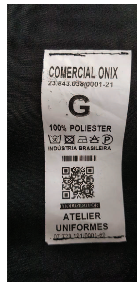
Etiqueta dos modelos das togas atuais utilizadas pelos Membros da Corte