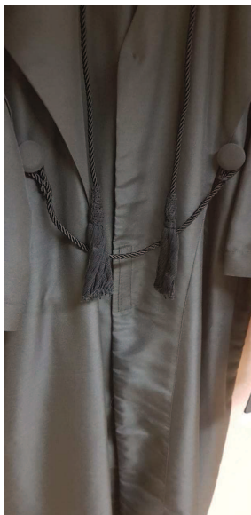
Detalhe do torçal utilizado pelas togas atuais.