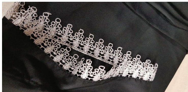
Modelo da renda dos punhos das togas que foram adquiridas recentemente e são utilizadas pelos Membros da Corte.