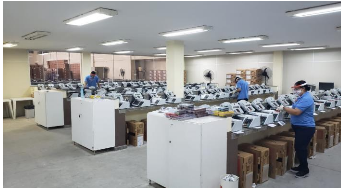
Atividade de manutenção das urnas eletrônicas no COJE

- Ações permanentes de esclarecimento e de suporte psicológico, adotadas pela Seção de Assistência Médica e Saúde Ocupacional/SGP, por meio de vídeos, de banners e de informativos divulgados na Intranet do TRE/RN;