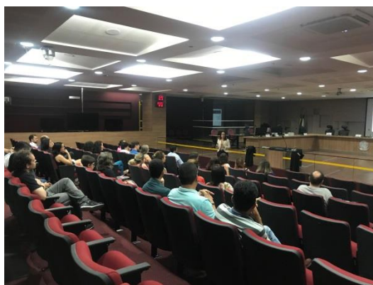
Palestra sobre saúde ocular

As palestras abordaram aspectos relevantes acerca dos cuidados preventivos para a manutenção da saúde ocular e da educação postural, incluindo, ainda, demonstrações aos presentes quanto ao uso correto do mobiliário existente na estação de trabalho.