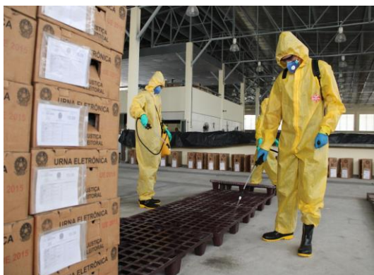
Desinfecção do COJE