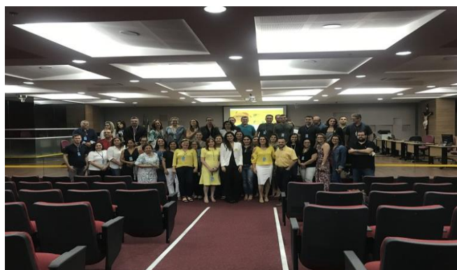
Participantes da palestra da campanha Setembro Amarelo