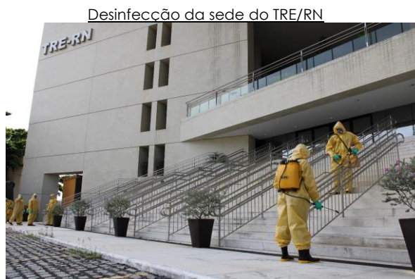
Desinfecção da sede do TRE/RN

- Elaboração e aprovação do plano de retomada gradual do trabalho presencial, definindo as medidas indispensáveis para a manutenção da segurança, da integridade e da saúde de todos – Resolução TRE/RN nº 28/2020: