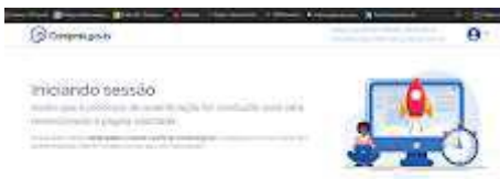
1Captura de tela 2024-08-15 101929.png 184K